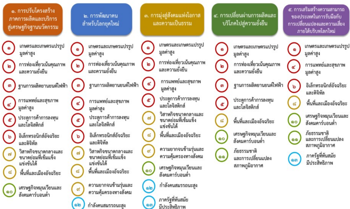
แผนภาพที่ ๓.๑ ความเชื่อมโยงระหว่างหมวดหมู่การพัฒนา กับเป้าหมายหลัก

ความเชื่อมโยงระหว่างหมวดหมู่การพัฒนา กับเป้าหมายหลักแสดงไว้ในแผนภาพที่ ๓.๑ โดยหมวดหมู่การพัฒนาที่กำหนดขึ้นเป็นประเด็นที่มีลักษณะเชิงบูรณาการที่ครอบคลุมการพัฒนาตั้งแต่ในระดับต้นน้ำจนถึงปลายน้ำ และสามารถนำไปสู่ผลพัฒนาทั้งในมิติเศรษฐกิจ สังคม ทรัพยากรธรรมชาติและสิ่งแวดล้อมไปพร้อมๆ กัน ทำให้หมวดหมู่แต่ละประการสามารถสนับสนุนเป้าหมายหลักได้มากกว่าหนึ่งข้อ นอกจากนี้การพัฒนาภายใต้แต่ละหมวดหมู่ไม่ได้แยกขาดจากกัน แต่มีการสนับสนุนหรือเอื้อประโยชน์ซึ่งกันและกัน